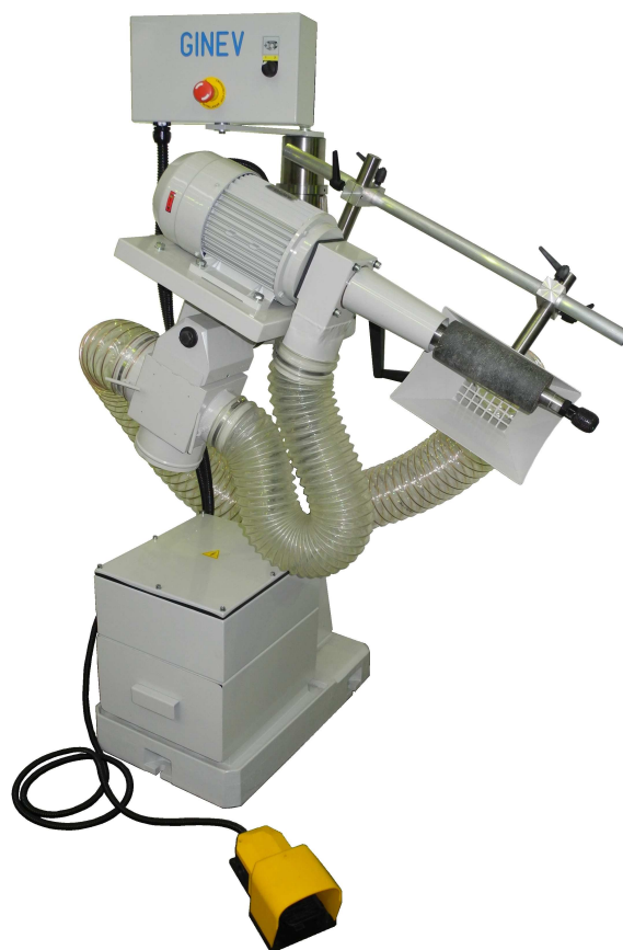
FR 2002 ORTHO CENTRALIZZATA